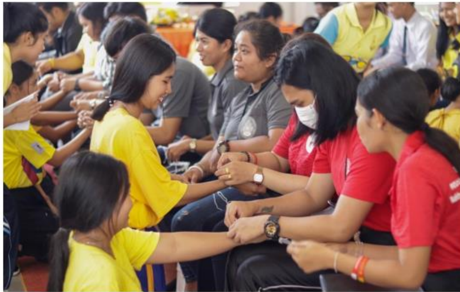
อาจารย์ประจำหอพักและรุ่นพี่เข้าร่วมกิจกรรมผูกข้อมือเพื่อต้อนรับและรับขวัญน้องๆเข้าสู่หอพัก

ผลปรากฏว่าหอพักปาริชาติ(B) เป็นผู้ชนะในกิจกรรมนี้ประจำปี 2562