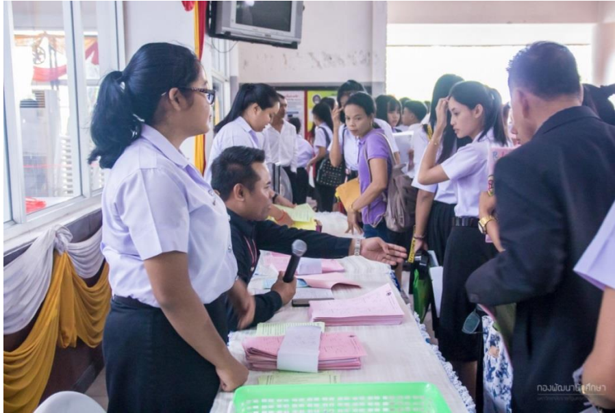
ผู้ปกครองและนักศึกษาใหม่ชั้นปีที่ 1 เข้าร่วมรายงานตัวเข้าหอพัก ณ หอประชุมมหาวิทยาลัยราชภัฏนครศรีธรรมราช