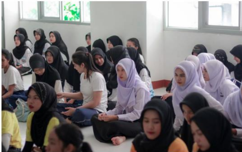
อิหม่ามและวิทยากรได้ให้ความรู้ด้านศาสนาและการใช้ชีวิตในรั้วมหาวิทยาลัยแก่นักศึกษา