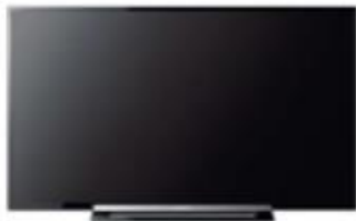
บริการระบบกล้องวงจรปิดภายในห้องพัก และโทรทัศน์ข้อมูลข่าวสาร