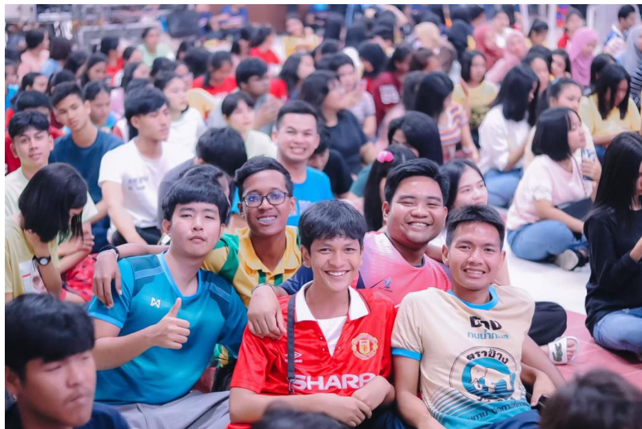
กิจกรรมในภาคค่ำเป็นการแสดงของแต่ละหอพัก ได้รับเสียงตอบรับจากนักศึกษาหอพักเป็นอย่างดี