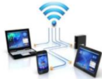
บริการสัญญาณอินเทอร์เน็ต Wi-Fi