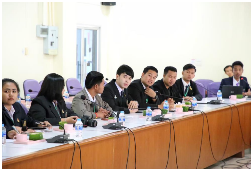
กิจกรรมพัฒนาบุคลากรด้านกิจการนักศึกษาสู่ความเป็นสากล และกิจกรรมสานสัมพันธ์ผู้นำนักศึกษาหอพักแลกเปลี่ยนเรียนรู้ ณ มหาวิทยาลัยเชียงใหม่