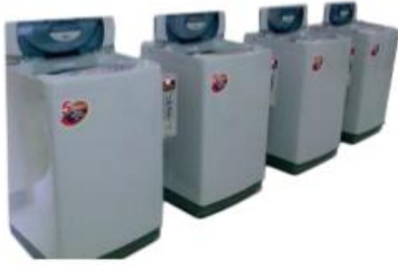
บริการเครื่องซักผ้าหยอดเหรียญ