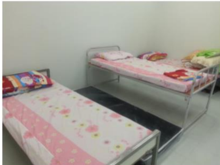
งานหอพักนักศึกษาได้จัดบริการห้องพยาบาลสำหรับอาการเจ็บป่วยในเบื้องต้น