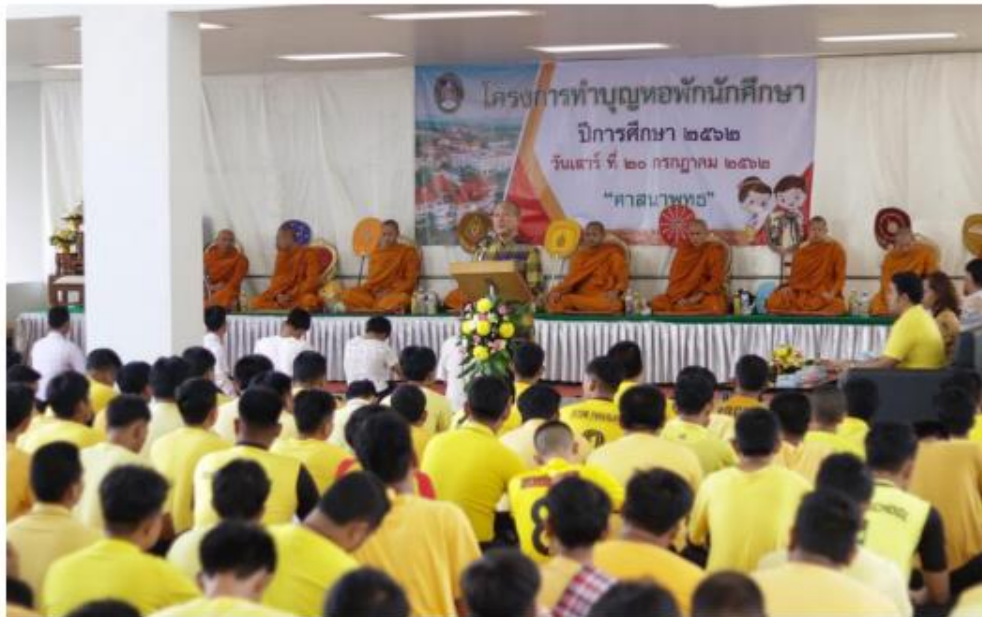
ท่านอธิการบดี คณะผู้บริหาร คณาจารย์พร้อมนักศึกษาเข้าร่วมกิจกรรมทำบุญหอพัก ประจำปีการศึกษา 2562 ณ ลานกิจกรรมหอพักขวัญสุตา (Z)