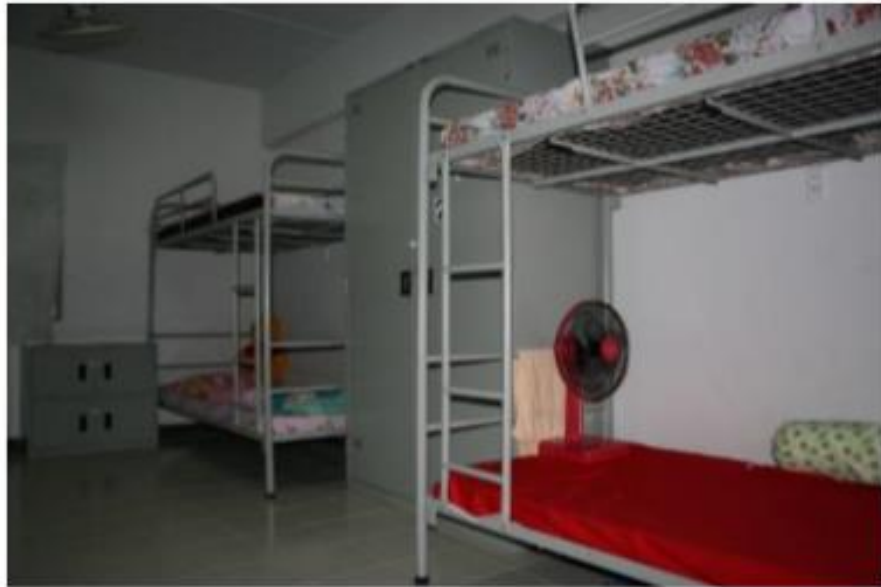
เตียง 2 ชั้นและฟูกขนาด 3 ฟุต