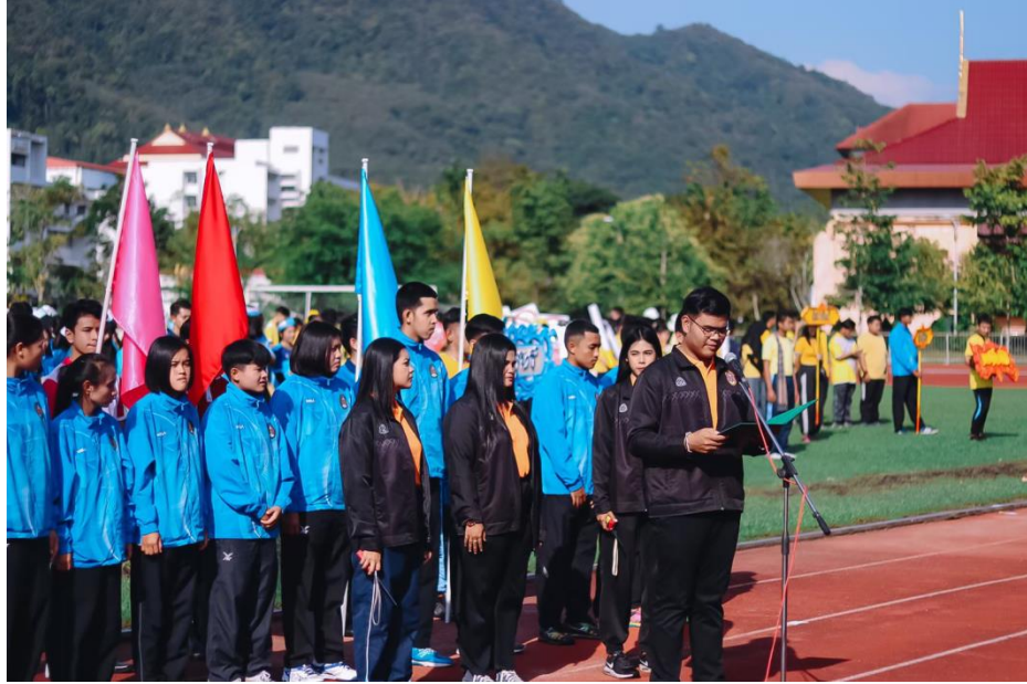
กิจกรรมกีฬาสามัคคีสัมพันธ์น้องพี่หอพัก (กิจกรรมภาคกลางวัน) จัดขึ้นเพื่อสร้างความรักความสามัคคีระหว่างพี่น้องชาวหอพัก ณ สนามกีฬามหาวิทยาลัยราชภัฏนครศรีธรรมราช