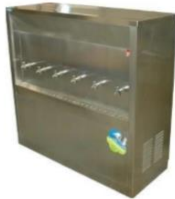
บริการน้ำดื่มสะอาดฟรีทั้งน้ำร้อนและน้ำเย็น