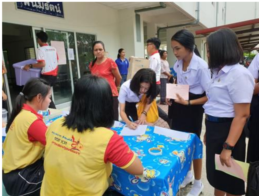
ผู้ปกครองและนักศึกษาลงชื่อเข้าเยี่ยมชมหอพักนักศึกษาพร้อมตอบแบบสอบถามความพึงพอใจ เพื่อนำไปสู่การพัฒนาการดำเนินงานหอพักนักศึกษาต่อไป