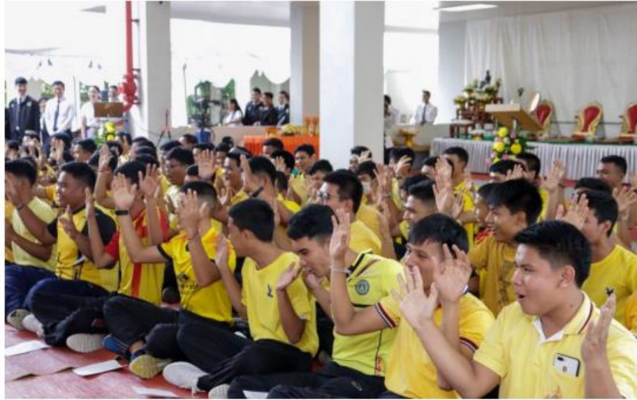
แต่ละหอพักเริ่มกิจกรรมประชันเชียร์เพลงประจำหอพัก

ผลปรากฏว่าหอพักปาริชาติ(B) เป็นผู้ชนะในกิจกรรมนี้ประจำปี 2562