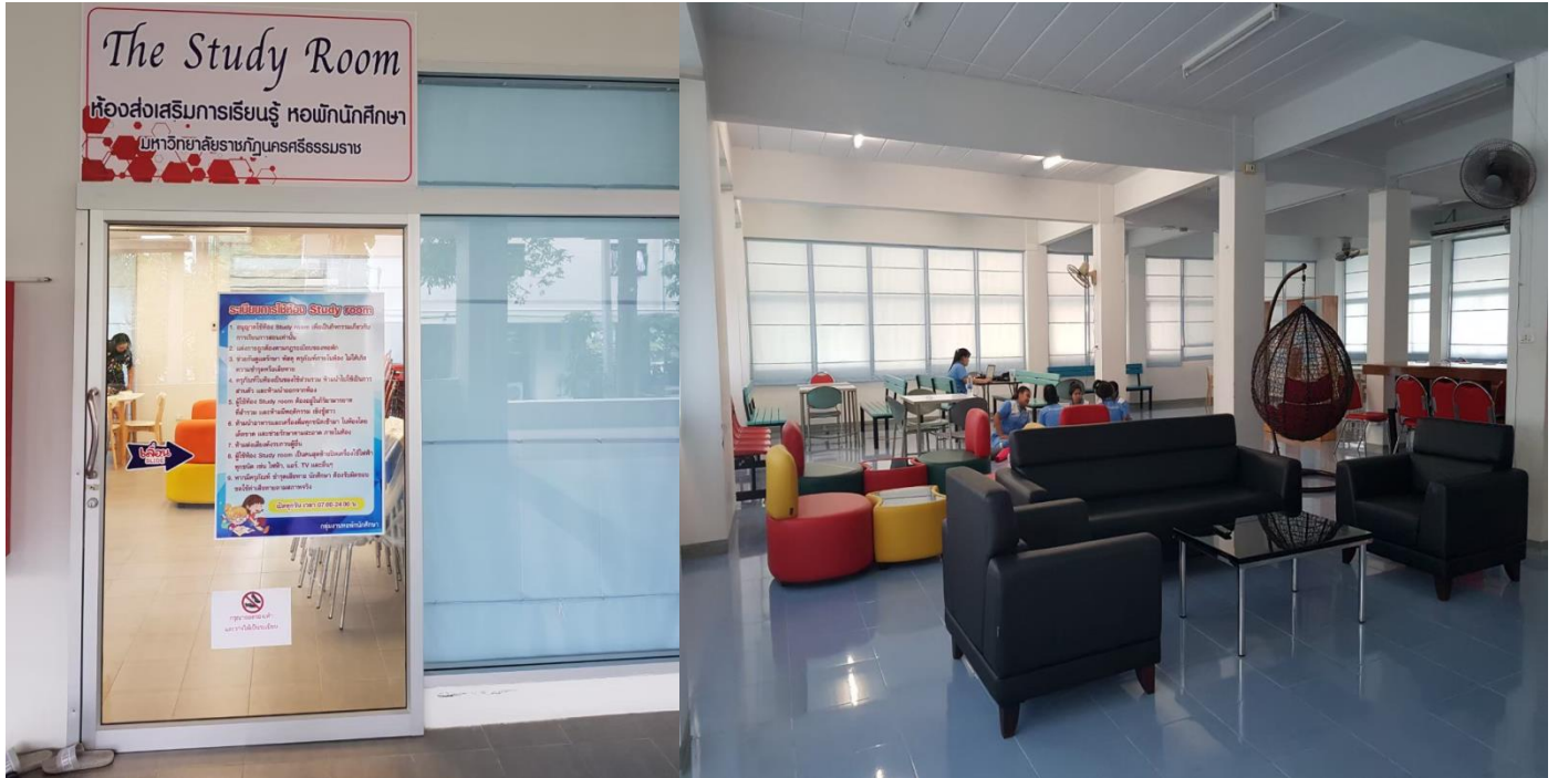
บรรยากาศห้องส่งเสริมการเรียนรู้(The study room) บริเวณหอพักต่างๆ