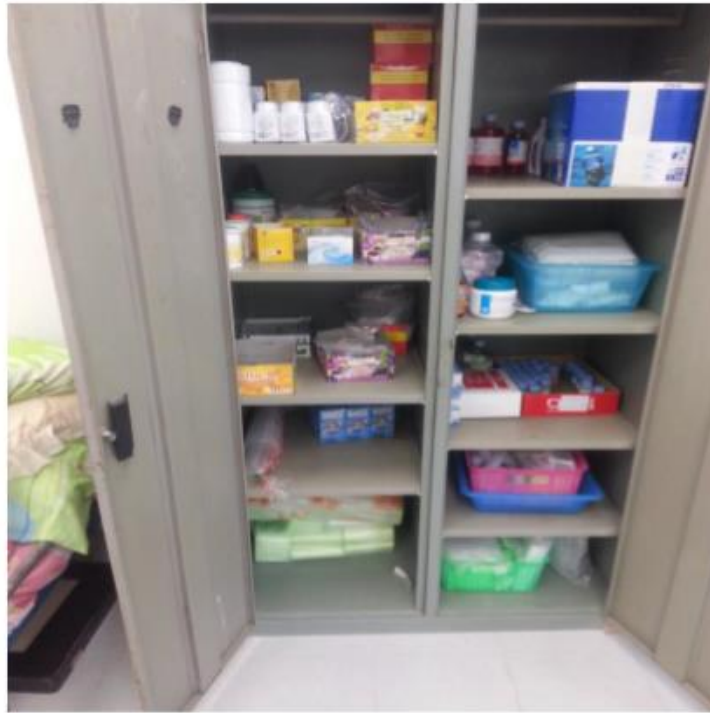
บริการยาและเวชภัณฑ์บริเวณชั้น 1 หอพักขวัญสุตา (Z)