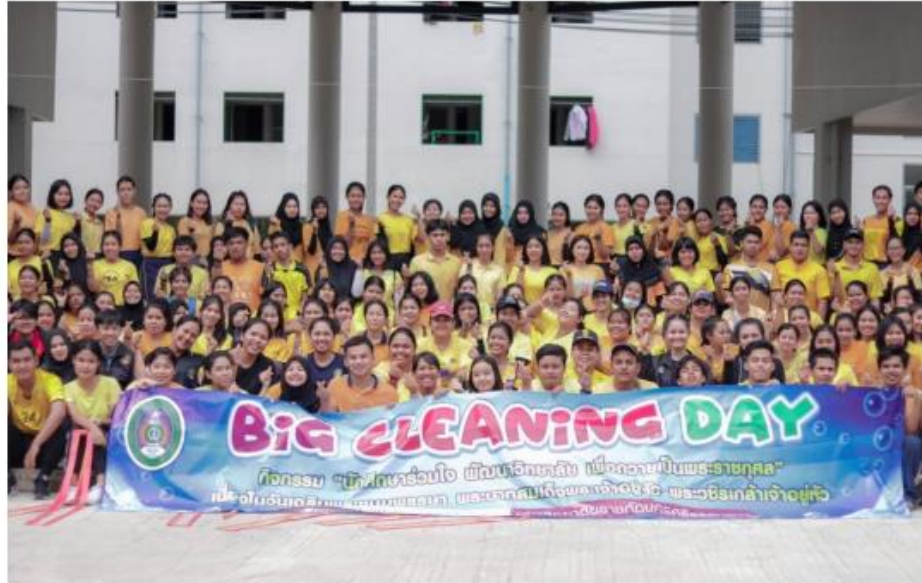
กิจกรรมจิตอาสาพัฒนาหอพักมหาวิทยาลัยราชภัฏนครศรีธรรมราชและบริเวณโดยรอบ